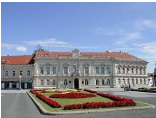
Gradska vijećnica Grada Koprivnice

Parking za automobile osiguran je iza Gradske vijećnice (kroz ulaz na parkiralište gradske tržnice, Trg dr T. Bardeka).